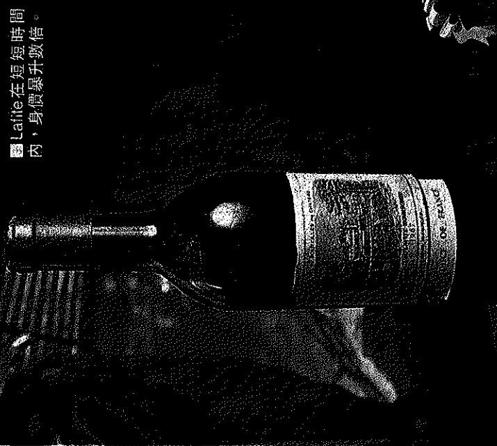
■ Lafite在短短時間內，身價暴升數倍。